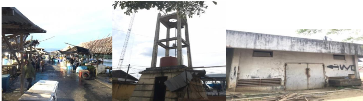
Gambar 1.1 Gambaran Umum Fasilitas Pelabuhan

Dari wawancara di atas dapat dilihat walaupun dengan adanya faktor penghambat tersebut namun Pelabuhan Perikanan ini sudah mampu memberikan dampak yang cukup baik dimana sangat berdampak bagi masyarakat sekitar seperti penyerapan tenaga kerja, dan peluang usaha lainnya yang dapat meningkatkan ekonomi masyarakat sekitar sehingga berpengaruh terhadap kesejahteraan masyarakat.