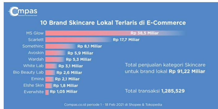
Gambar 1.1 Brand Skincare terlaris di E-Commerce

MS Glow Cosmetic, perusahaan perawatan kulit terkemuka dengan penjualan stabil, meraih Best Brand Award 2020 untuk kategori " Exclusively Sold Facial Treatment ". Produk mereka telah terdaftar BPOM dan memenuhi standar Good Manufacturing Practice (GMP), menjamin kualitas dan keamanan. Meskipun ada kekhawatiran tentang kandungan zat hewani dalam produk, label halal meyakinkan konsumen akan keamanannya. Keputusan pembelian dipengaruhi oleh berbagai faktor, termasuk pengalaman konsumen dengan produk, yang berdampak pada kepuasan dan peluang pembelian di masa depan (Philip, Keller, & Chernev, 2022). Pengalaman positif pelanggan juga berkontribusi pada keberlanjutan bisnis dan kepuasan pelanggan (Tanady & Fuad, 2020).