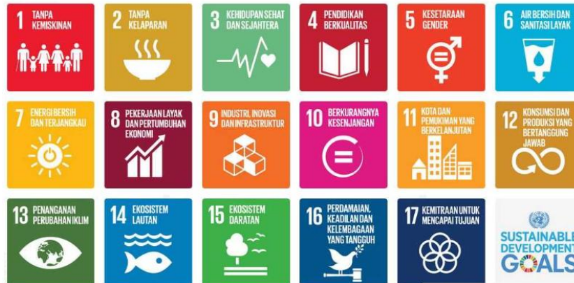
Gambar 1. SDGs