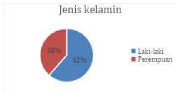
Gambar 4.1 Hasil Persentase Jenis Kelamin