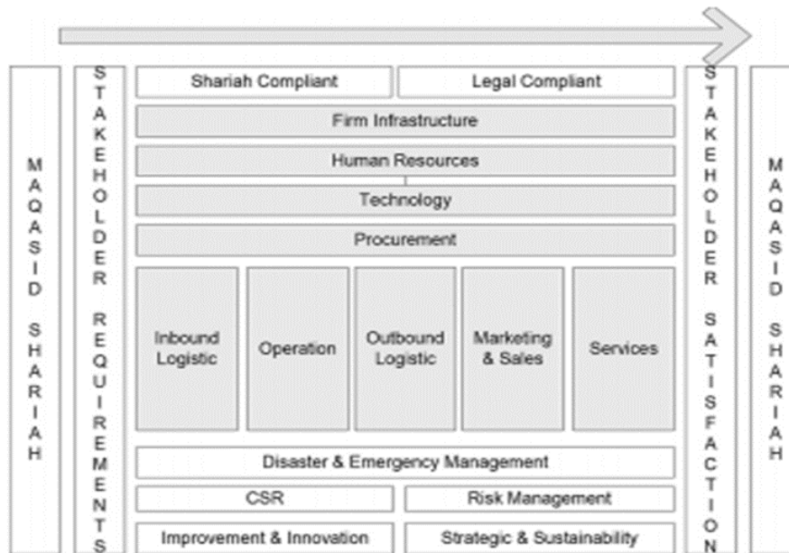
Gambar 2. Fondasi Kemaslahatan Orientasi Proses Internal (Firdaus dan Yusuf, 2014)

Gambar 2 diadopsi oleh Firdaus dan Yusuf (2014) dari konsep maqasid Syariah dan model value chain yang dikembangkan oleh Michael Porter (1998). Firdaus dan Yusuf (2014) menunjukkan keterkaitan antara proses utama (inbound logistic, operation, outbound logistic, marketing and sales, services) dan proses pendukung (firm infrastructure, human resources, technology dan procurement). Proses utama dan proses pendukung harus sesuai dengan shari'ah dan hukum yang berlaku. Selain itu, organisasi juga harus mempersiapkan kemampuan manajemen bencana dan kedaruratan, tanggung jawab social perusahaan, manajemen resiko, inovasi dan perbaikan, serta strategi dan keberlanjutan organisasi. Input pada value chain harus disesuaikan dengan kebutuhan pemangku kepentingan dan maqasid syariah, sedangkan tujuan organisasi harus diupayakan untuk mencapai kepuasan pemangku kepentingan dan maqasid shari'ah.