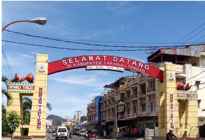
Gambar 1. Tugu Selamat Datang Tapanuli Tengah

Sibolga adalah ibu kota keresidenan Tapanuli yang berada di pesisir pantai barat Sumatera Utara membujur sepanjang pantai dari Utara ke Selatan dan berada pada kawasan Teluk Tapian Nauli. Jaraknya sekitar 350 km dari kota Medan, atau sekitar 8 jam perjalanan memiliki luas 10,77 km 2 dan memiliki penduduk sebanyak 89.584 jiwa, dengan kepadatan penduduk 8.318 jiwa/ km 2 .