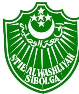
Gambar 3. Logo Kampus STIE Al Washliyah Sibolga