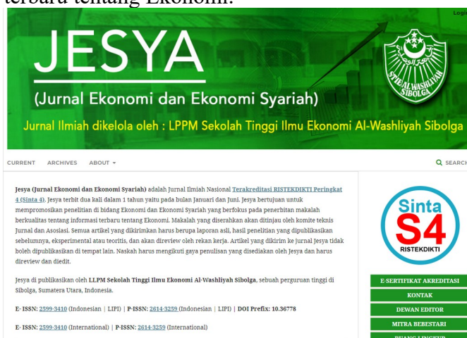
Gambar 4. Tampilan Beranda Jurnal Jesya