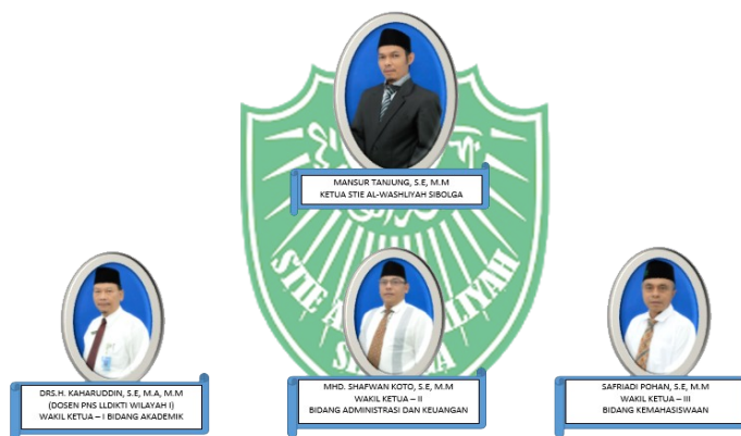
Gambar 5. Susunan Pimpinan STIE Al Washliyah