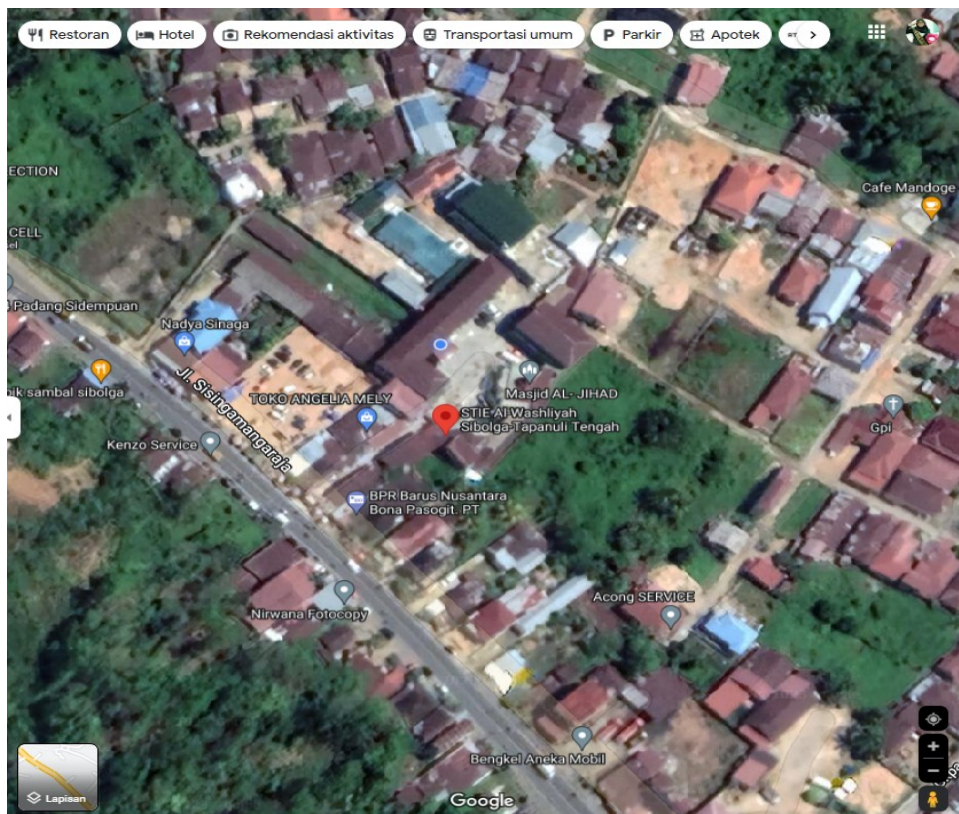
Gambar 2. Peta Lokasi Kampus STIE Al Washliyah Sibolga

Sejalan dengan waktu dengan jumlah mahasiswa semakin bertambah sedangkan tempat lahan parkir tidak tersedia maka pendiri STIE Al Washliyah Sibolga dan Pimpinan pada waktu itu mulai memikirkan untuk meminjam Ruang Belajar SMA Negeri 3 dan Gedung Islamiyah Sibolga untuk pelaksanaan proses perkuliahan tetap berjalan, maka dengan segera Pimpinan mengambil inisiatif membentuk kepanitian Pembangunan Kampus STIE Al Washliyah Sibolga diketuai oleh Bapak Drs.H.Agussalim Harahap,MM, dan mendapatkan bantuan APBD Sibolga 2003/2004, untuk memulia pembangunan Kampus milik sendiri yang beralamat di Jalan Padangsidimpuan Km.5 Sarudik.