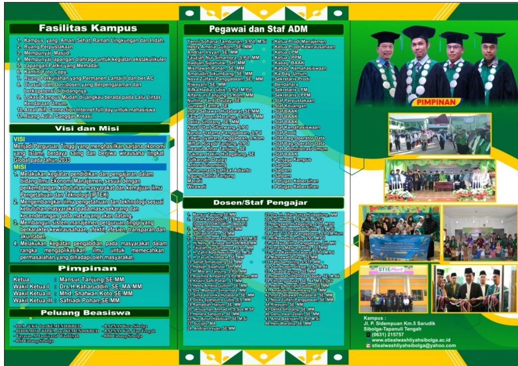
Gambar 7. Brosur Penerimaan Mahasiswa Baru STIE Al Washliyah Sibolga Tahun 2023/2024